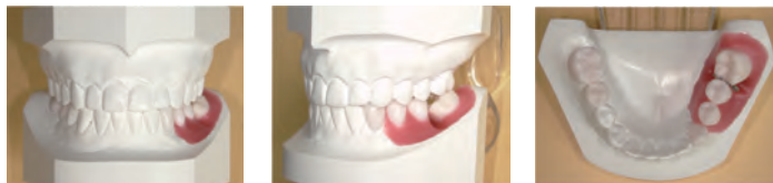
図3 タイポ4(大臼歯のアップライト)