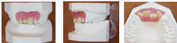
図1 タイポ2(歯性反対咬合)