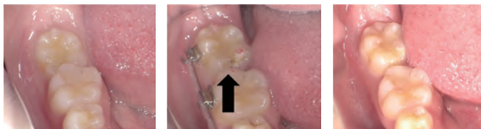
図4 近心傾斜大臼歯(左)、カリエス発見(中)、カリエス処置(右)