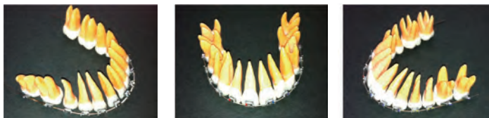
図2 タイポ3(歯根配列チェック)