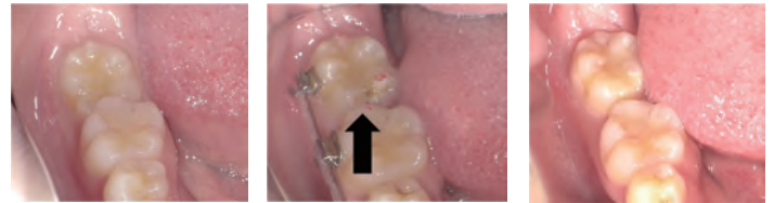
図2 近心傾斜大臼歯(左)、カリエス発見(中)、カリエス処置(右)