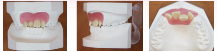
図1 タイポ2(歯性反対咬合)