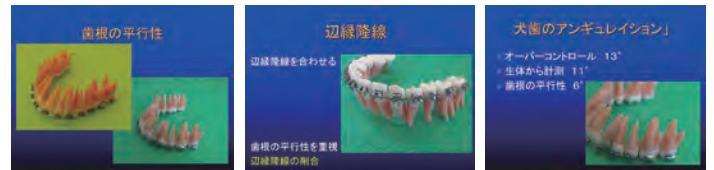
図4 タイポ3(ブラケットポジションを歯根配列でチェック)